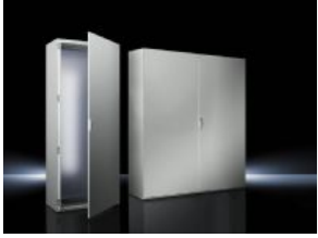
Sistema de armarios individuales SE 8

Tenga en cuenta por favor también los productos alternativos siguientes: