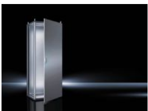
Sistemas de ensamblaje TS 8 IP 66/NEMA 4X