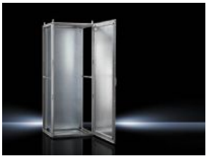
Sistemas de ensamblaje TS 8 Armarios EMC