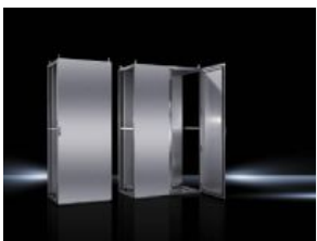
Sistemas de ensamblaje TS 8 Acero inoxidable