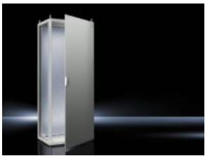
Sistemas de ensamblaje TS 8 IP 66/NEMA 4